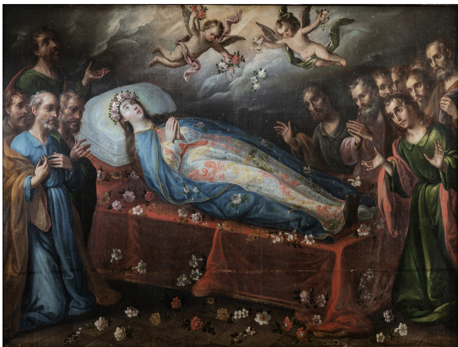
Figura 6. Antonio de Torres, Dormición de la Virgen , 1713, Seminario de Sacerdotes Operarios Diocesanos, México.