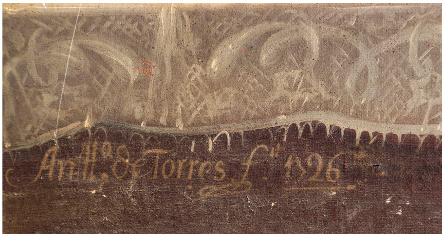
Figura 5. Antonio de Torres, Santo Ecce Homo del Portal (detalle de la fecha y firma del pintor), convento de la Encarnación de clarisas franciscanas de Granada.