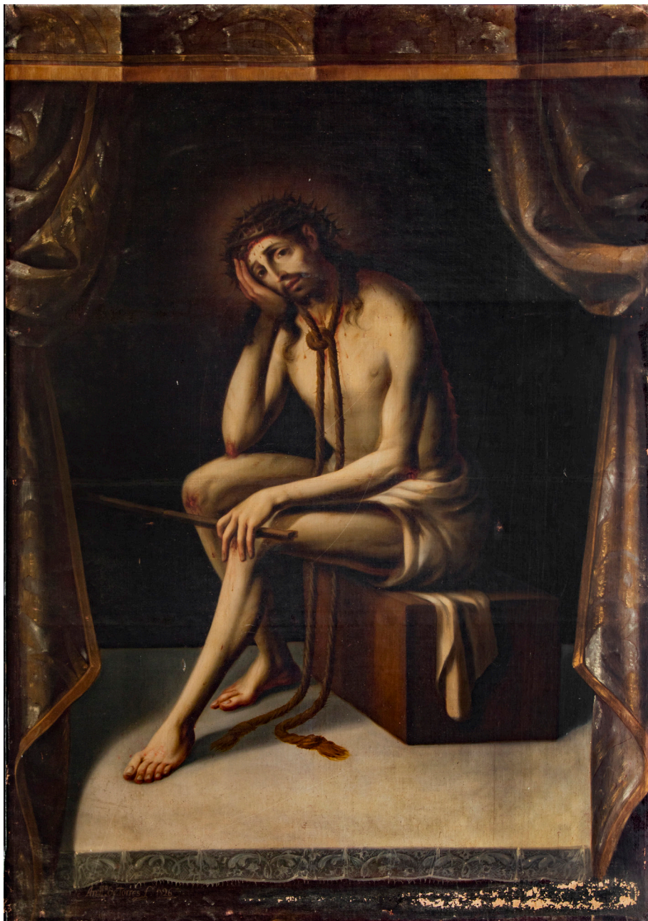
Figura 4. Antonio de Torres, Santo Ecce Homo del Portal , 1726, convento de la Encarnación de clarisas franciscanas de Granada.