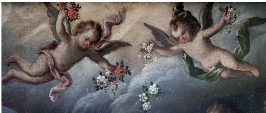
Figura 8. Antonio de Torres, Dormición de la Virgen (detalle de los ángeles echando flores a la Virgen María), Seminario de Sacerdotes Operarios Diocesanos, México.