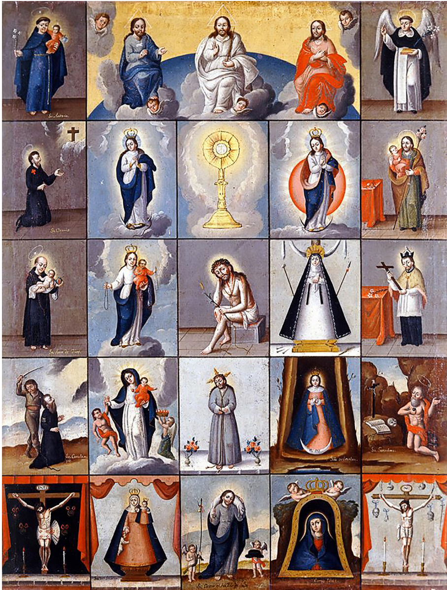
Figura 3. Anónimo, Devocionario mexicano , 1827, Museo Nacional del Virreinato.