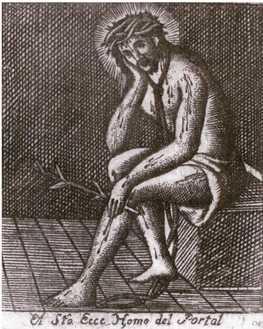
Figura 2. Santo Ecce Homo del Portal , grabado inserto en Gómez Durán, 1778.