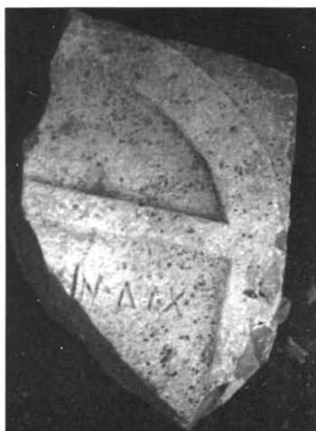
Inscripción n.º 8

cripción de i por e , un fenómeno, como la grafía de la D , indicativo de arcaísmo y también a veces de indigenismo 43 ; por otro lado, que lo que aparezca sea la mención de un nombre indígena de tipo céltico semejante a tantos documentados en la Galia 44 ; si así fuese cabría datar la inscripción a comienzos del siglo I d.C., siendo así un testimonio más a aportar para la revalorización que la investigación actual está realizando de la permanencia y vitalidad del sustrato indígena en las campiñas béticas 45 . Esa misma datación la podría confirmar, a pesar del poco espacio conservado en el fragmento, lo escueto del formulario.