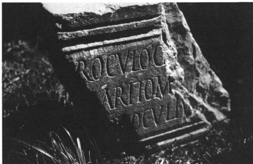
Inscripción n.º 5