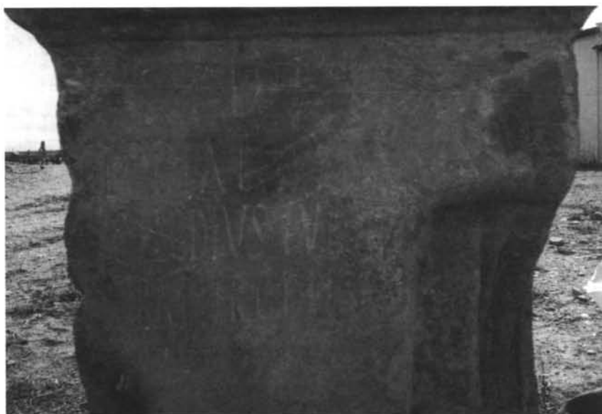
Inscripción n.º 2 (detalle)