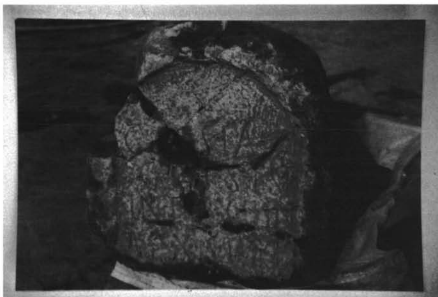
Inscripción n.º 7

Las letras son capitales cuadradas que en líneas generales mantienen un módulo igual entre todas; a partir de los rasgos de la S y T, en combinación con la presencia de la fórmula de las dimensiones de la tumba, abogan por una datación ya avanzado el siglo I d.C. lo que concuerda relativamente con la ausencia de cognomen , hecho que generalmente indica una fecha en torno a 100 d.C. o anterior 35 . Por