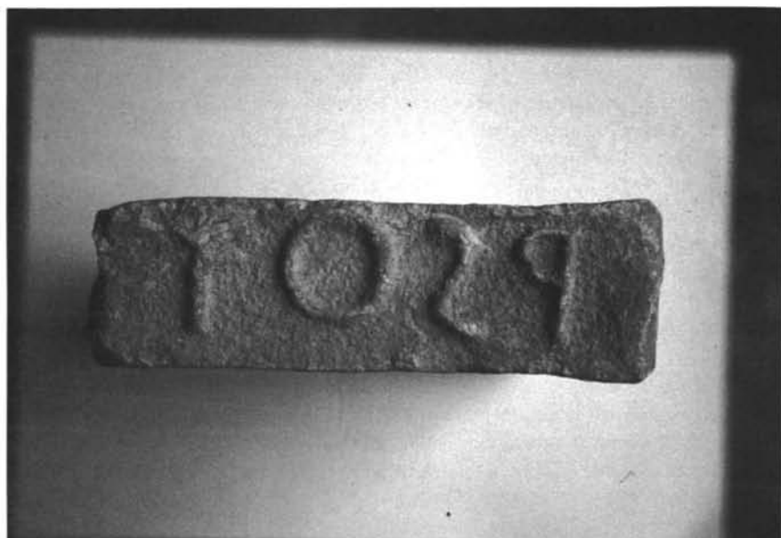
Inscripción n.º 9

propio de una villa rústica 54 y la zona industrial alfarera aneja con los hornos cerámicos. Es bien conocido el hecho de que la explotación de los bancales de arcilla era una actividad de tipo industrial estrechamente vinculada al mundo de la agricultura, y que desde ese punto de vista no se consideraba una actividad impropia de una persona de alcurnia 55 . Las marcas de ánfora localizadas en la zona o en los lugares de consumo del aceite aquí envasado son considerables 56 y algunas de ellas han permitido conocer el nombre de la figlina dependiente de la villa donde apareció nuestro ladrillo, la figlina Scimnia 57 ; el nombre de uno de las fincas o fundi ( fundus Arclesis ) 58 cuya producción aceitera se almacenaba en las ánforas fabricadas en el complejo de Las Delicias; y, con menos seguridad, el nombre de una de las obras de regulación del caudal del Genil, el portus Sed(...) 59 .