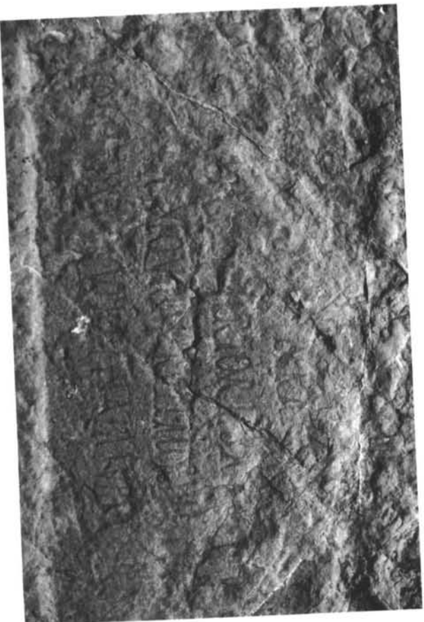
Inscripción n.º 4 (detalle)