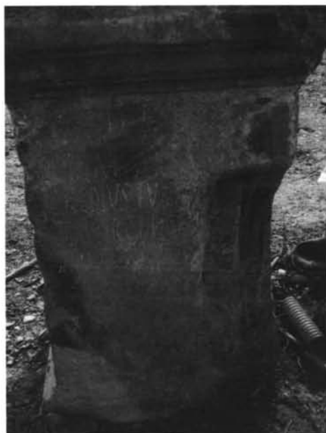
Inscripción n.º 2