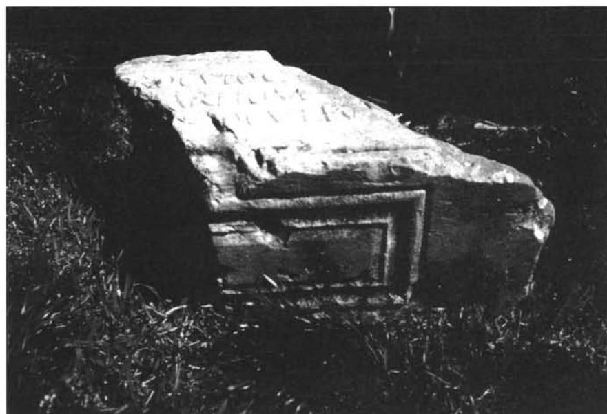
Inscripción n.º 5 (detalle parte inferior)