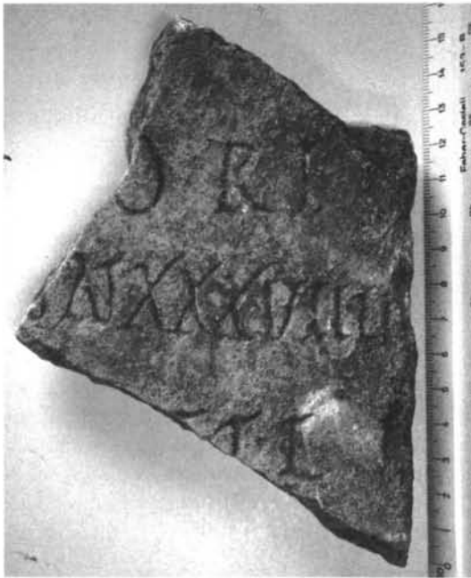
Inscripción n.º 3

El fragmento corresponde a la parte derecha de la placa, y sus medidas son las siguientes: grosor de 2 cm., con unas dimensiones máximas de 11 cm. x 16 cm.; las