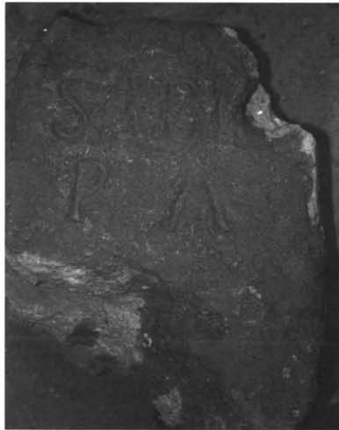
Inscripción n.º 6

Por la relativa distancia existente entre la P y la A de la segunda línea, es factible suponer que se trate de abreviaturas, con lo que quizá estemos ante una dedicación por parte de algún Sabinus o Sabina , cognomen del que ya nos hemos ocupado en líneas anteriores, con la fórmula P(osuit) A(nimo) [L(ibens)] o similar. El tipo de las letras, capitales cuadradas, y el escaso texto conservado no permite afinar bien la datación, que podemos situar en el siglo II d.C.