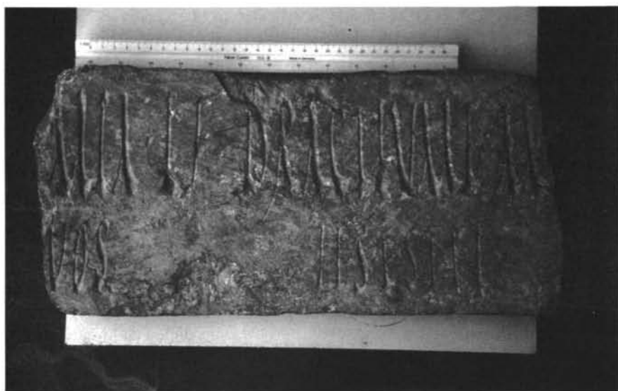
Inscripción n.º 1

Se trata de una inscripción funeraria cuyo texto no tiene dificultades de lectura, y cuyo tenor es el siguiente: