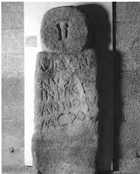
ILUSTRACIÓN 2. Estela de Sta. Eulalia de Tines (Vimianzo, A Coruña). Museo Arqueológico e Histórico de San Antón (A Coruña).

La datación del resto de las estructuras funerarias permite establecer el origen de la necrópolis de Sta. Eulalia de Tines en la romanidad tardía. Un asunto complicado es qué tipo de relación existe entre la villa y la necrópolis. Chamoso no define siquiera el ámbito espacial ocupado por los restos romanos y las sepulturas, refiriendo únicamente la presencia de tumbas de lajas graníticas, ladrillos y tégu-