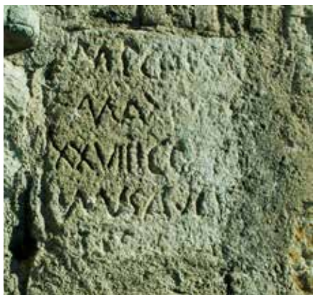
Figura 3. Fragmento 1.