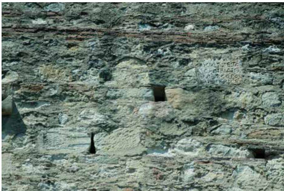
Figura 6. Situación del fragmento 2 del terminus augustalis y del epitafio.

territorios atestiguados en el nuevo hallazgo son coincidentes con los dos atestiguados en CIL II, 5033 : Mirobrigenses y Copolibedenses . Hernández Guerra, Jiménez de Fundarena 12 han defendido que CIL II, 5033 se trataba originalmente de un trifinio, añadiendo Salm(anticenses) , que suponen perdido por la rotura del soporte. No obstante, esta propuesta no parece convincente, según han refutado otros autores 13 y, además, porque el espacio faltante por rotura es exiguo y los autores habían partido de Polibenses , no de [- -]/ polibedenses .