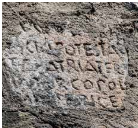
Figura 4. Fragmento 2.