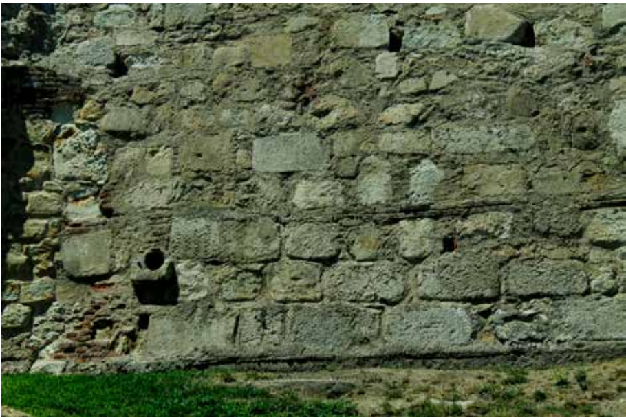
Figura 2. Fragmento 1.