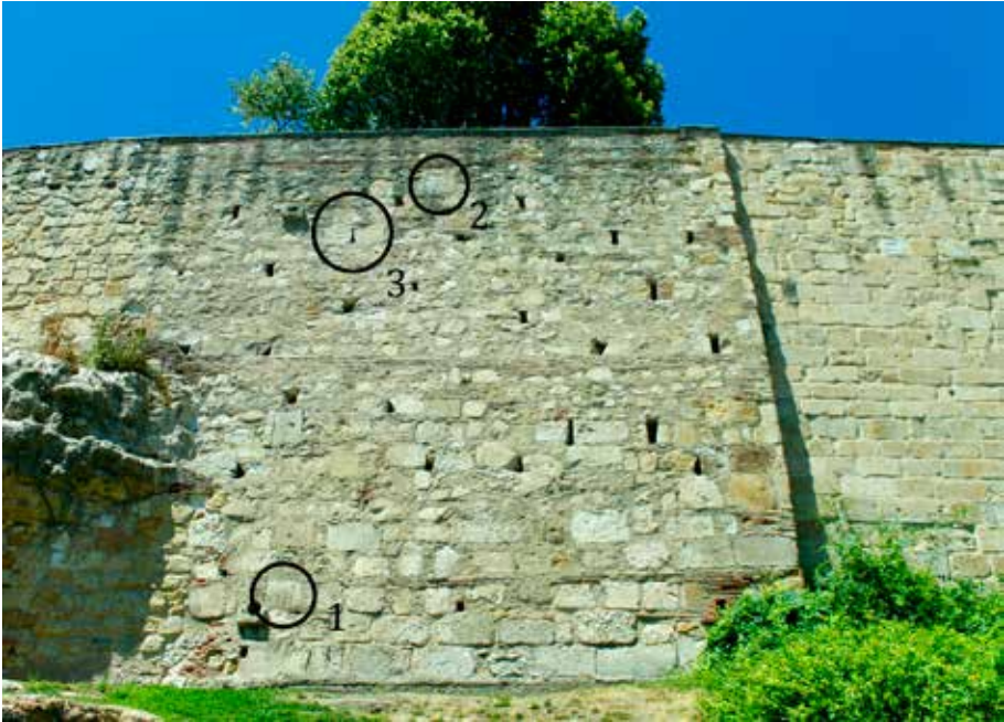
Figura 1. Situación de los hallazgos