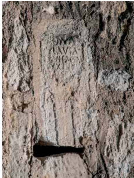
Figura 7. Epitafio.

Cronología: la presencia de la fórmula DMS permite datar la inscripción en el siglo II d. C. o posterior.