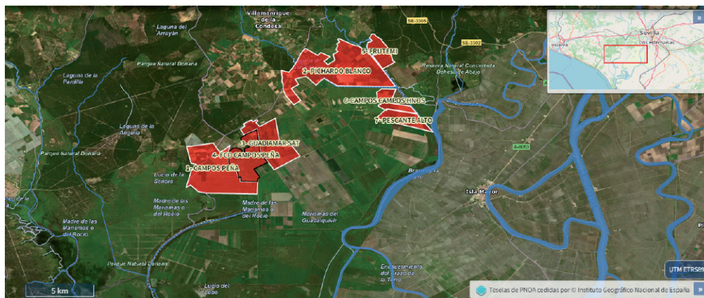
MAPA 2. Localización de las fincas de los mayores usuarios de agua del acuífero Marismas. Elaboración propia. Fuente: CHG.

sociales, insuficiente rigor en el planteamiento de alternativas, debilidad de los procesos de consulta y falta de transparencia.