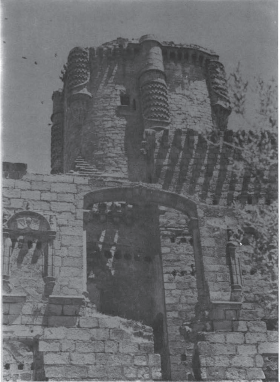
Castillo de Belalcázar.