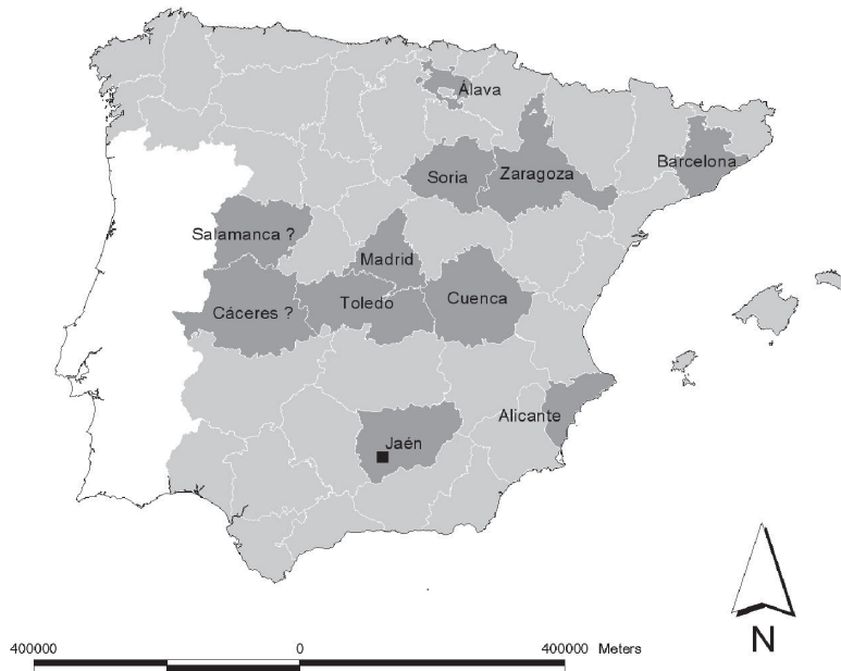
Fig. 1. Distribución conocida de Rumex cristatus DC. en España. En gris oscuro se resaltan las provincias en las que hay referencias de su presencia (el signo “?” en Salamanca y Cáceres indica presencia dudosa). En la provincia de Jaén, el símbolo (■), indica el lugar donde se ha localizado la población.

Rumex cristatus en la Península Ibérica sea aún más amplia, ya que es muy probable que en ocasiones se haya podido confundir con Rumex crispus L., no sólo por la similitud de ambos taxones, sino también por habitar medios ecológicos similares.