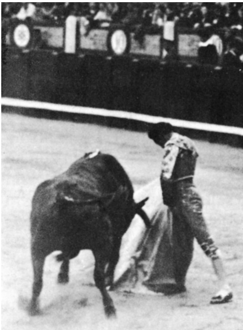
Fig. n.º 2.– Curro Puya toreando en Madrid (apud Claramunt, Historia Ilustrada de la Tauromaquia , Espasa-Calpe, 1989: 101).