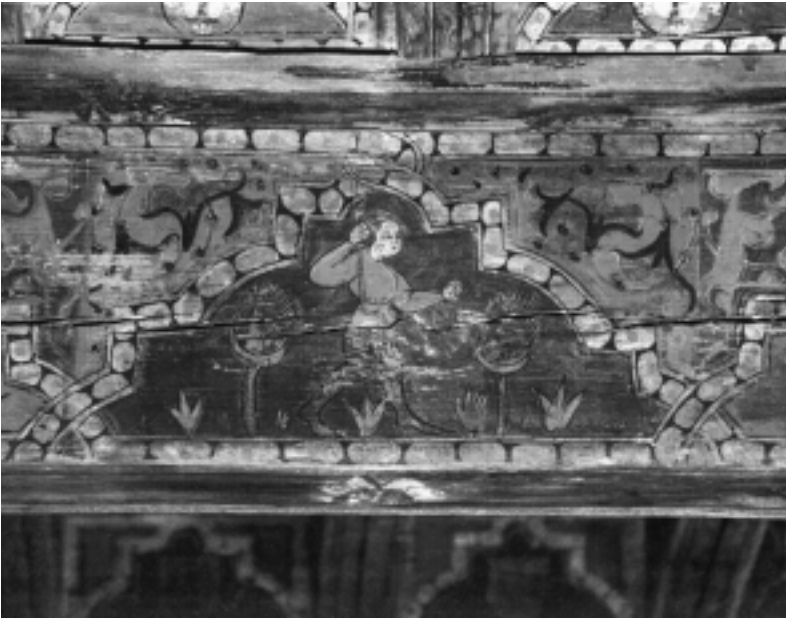
Fig. n.º 8.- Otra representación de matatoros o alanceador.

Este motivo concreto de alancear toros a pie y en solitario tiene uno de sus antecedentes en el mundo romano, donde los llamados venatores se enfrentaban a los toros únicamente