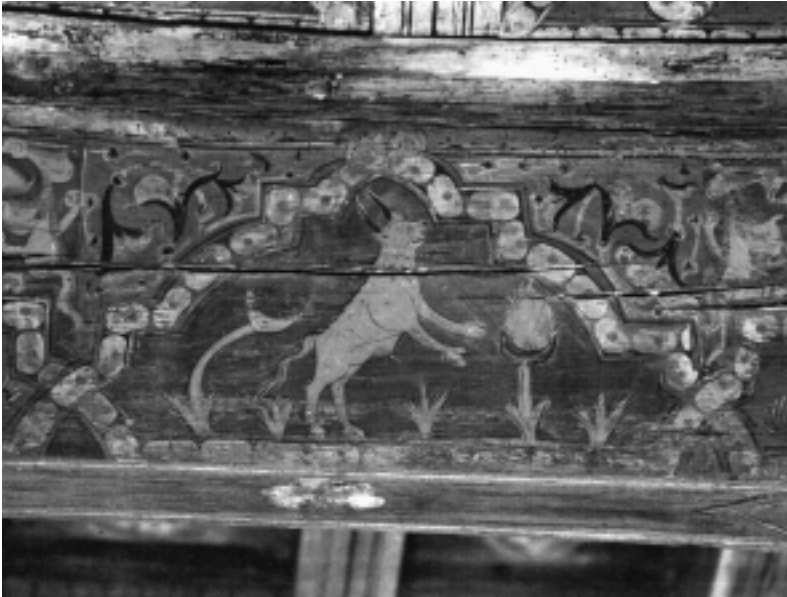
Fig. n.º 15.— Toro rampante y corniveleto (Foto cedida por el archivo del Monasterio de Silos).

rístico de las ciudades medievales, se improvisaban cercados en las afueras de las mismas donde los espectadores observarían, sin peligro, el desarrollo de la lidia. Refiriéndonos a los «toreadores», diremos que el primer caballero sigue la pauta marcada, montando un caballo blanco y en actitud de acome-