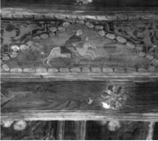
Fig. n.º 10.— Jinete avanza hacia el toro galopando sobre un caballo de color blanco y armado con una lanza (Foto cedida por el archivo del Monasterio de Silos).