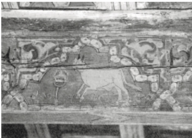
Fig. n.º 4.– Toro perfectamente anatomizado, enfrentándose al mozo de la figura anterior.