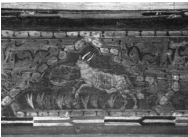
Fig. n.º 6.– Toro alzado embiste, frente al mozo de la figura anterior (Foto cedida por el archivo del Monasterio de Silos).