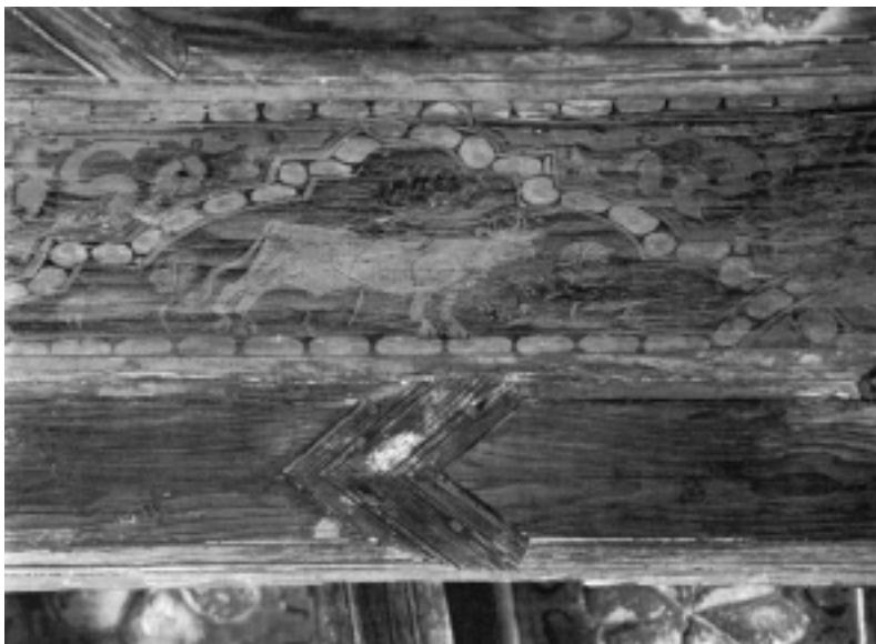
Fig. n.º 11.— El toro, situado entre los caballeros de la página anterior, se halla herido de muerte (Foto cedida por el archivo del Monasterio de Silos).