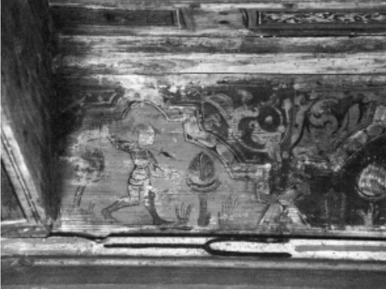
Fig. n.º 7.– Matatoros o alanceador.

En la galería oeste señalamos otras tres escenas dobles. En la primera el joven alanceador (Fig. n.º 7) está representado en el momento concreto de lanzar su arma hacia el toro que, mientras tanto, permanece quieto sobre el paisaje. La