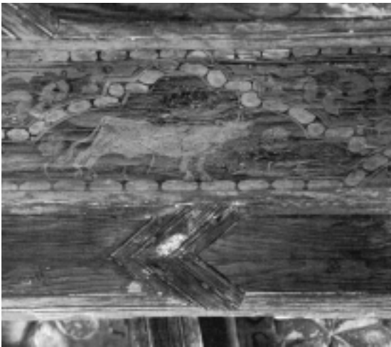
Fig. n.º 12.— Este segundo caballero, con la cabeza vuelta hacia atrás, observa la situación de la lidia y cómo reacciona el toro tras la lucha (Foto cedida por el archivo del Monasterio de Silos).