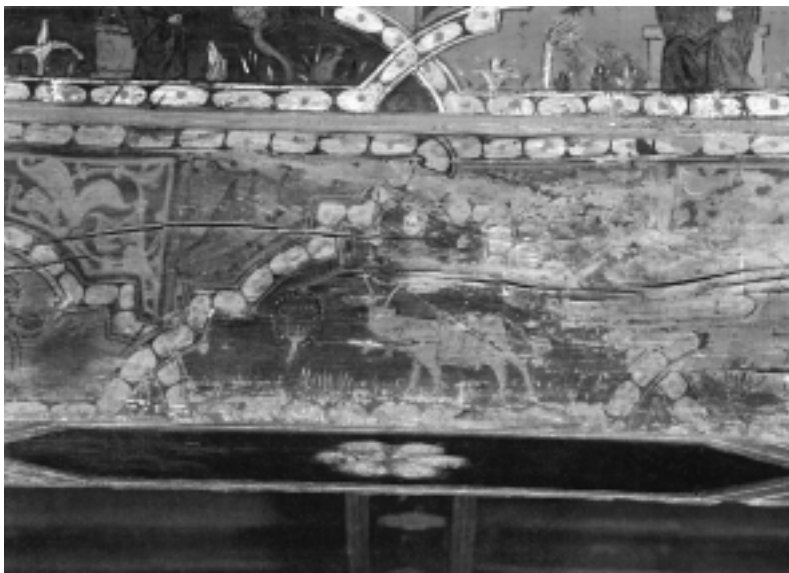
Fig. n.º 14.– El toro, con defensas más superiores, astifinas (Foto cedida por el archivo del Monasterio de Silos).

intención, suponemos, de arrojarlos sobre el animal 2 . La figura femenina, en un estado de conservación no muy aceptable, está vestida con ropa ajustada y de poco lujo, cubriéndose la cabeza con un sencillo gorro. Este hecho de la presencia de espectadores implica, por un lado, la consideración