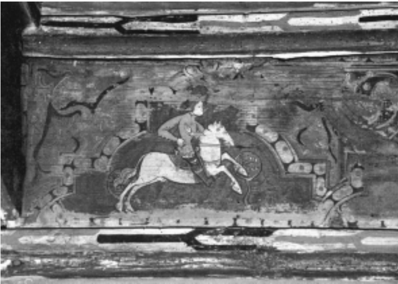
Fig. n.º 9.- Caballero armado con una lanza.

la catedral de Pamplona o en la sillería de coro de la catedral de Plasencia, ambas del siglo XV, y los ya citados cantorales del monasterio de Guadalupe, un siglo más tarde. Esto nos demuestra cómo dicha práctica taurina se perpetúa y arraiga fuertemente en la sociedad, hasta tal nivel de naturalidad, como para ser representados en lugares que en principio nos parecerían inapropiados, caso de iglesias, monasterios u objetos de uso litúrgico. Es más, la suerte de