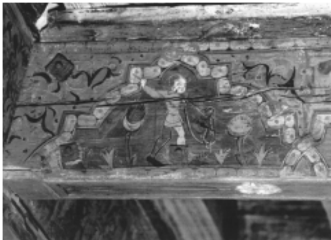
Fig. n.º 3.– Matatoros , armado con venablo y vestido con un capote de color verde, avanza sobre el paisaje y se enfrenta cara a cara con el toro de la figura siguiente.