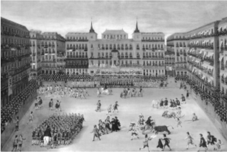
Fig. n.º 17.– Anónimo: Panorámica de la Plaza Mayor de Madrid , mediados del siglo XVII, óleo sobre lienzo, 135 x 200 cm., Madrid, colección particular.

co comercial entre España e Italia. Durante el siglo XVIII, la producción de azulejos policromos catalanes llegó a su esplendor. Los alfareros no daban abasto con los encargos de enormes composiciones murales, zócalos, pavimentos, frisos y frontales de altar decorados con temas religiosos y profanos (Casanovas, 1984: 39-45).