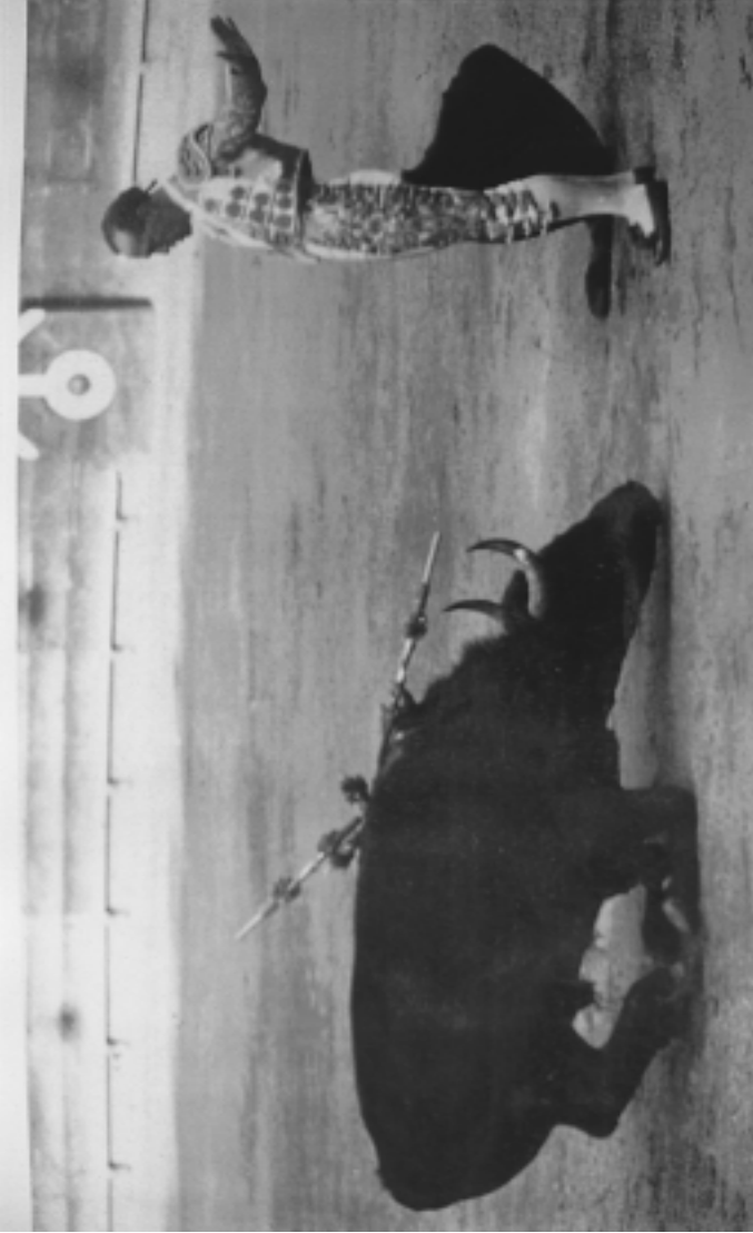
Lám. n.º 27.— El toro dobla a consecuencia de la estocada fulminante.