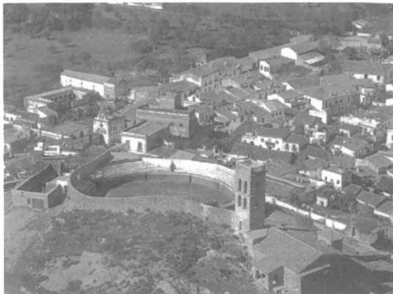
Fig. n.º X.6.— Plaza de toros de Almonaster la Real (Huelva). La plaza de toros se halla contigua al santuario, una antigua mezquita (Apud G. Díaz-Yraola Recaséns, 1992: Plazas de Toros , Sevilla, Consejería de Obras Públicas, 1992, pág. 35).

distribuirla equitativamente para que las familias se la lleven y se cocina en casa, como ocurre, por ejemplo, en Soria capital. Hay un restaurante en Madrid y también otro en Barcelona que están especializados en servir carne de toro de lidia. En la carta se especifica el nombre del toro, la ganadería a la