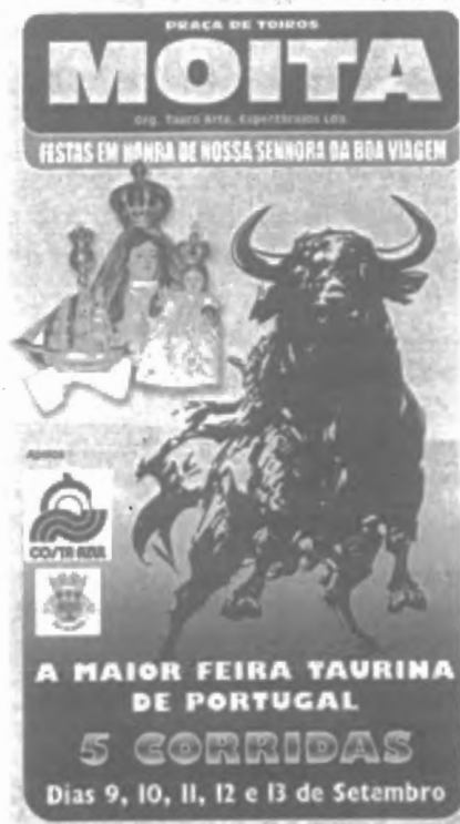
Fig. n.º X.1.— Cartel de la feria taurina de Moita (Portugal) colocada bajo la abvoción de Nuestra Señora de Begoña (Apud publicidad inserta en la revista taurina 6TOROS6, 2002, n.º 247, pág. 47).

más de la mitad de los toros sacrificados en las corridas en España se corren en honor de la Virgen María como parte de la celebración de una fiesta religiosa (Fig. n.º X.1). El calen-