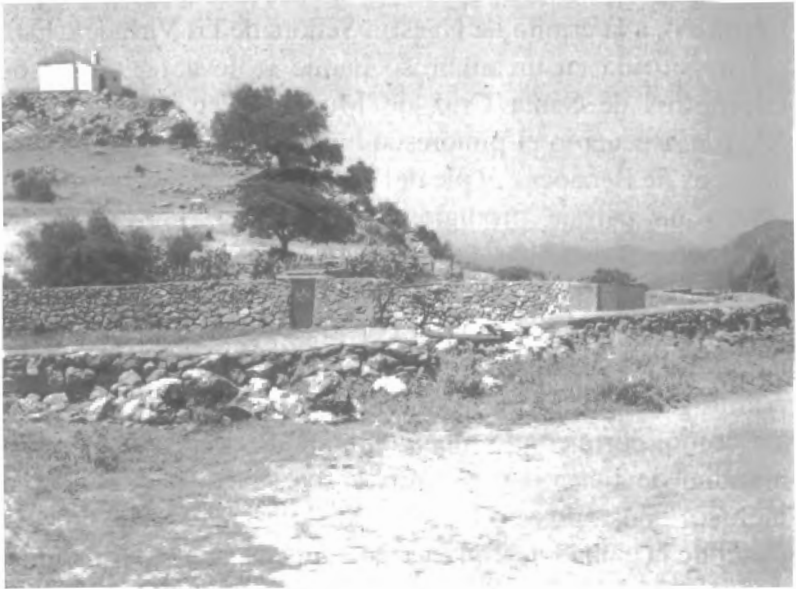
Fig. n.º X.5.— Ermita de Benaocaz elevada sobre el cerro. En primer plano, la plaza de toros. (Fot. de P. Romero de Solís). Aunque los edificios no se tocan la disposición es de tal suerte que resulta imposible sustraerse a la impresión de que ambos edificios están de alguna manera relacionados.

la Misericordia, una institución de beneficencia estrechamente vinculada a la iglesia local, etc. La organización de la fiesta era una fuente de ingresos y la carne de toro se distribuía entre los enfermos de los hospitales y casas de caridad siendo, probablemente, la única carne que comían en todo el año.