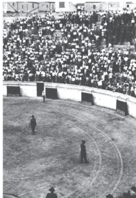
Fig. n.º 43.- La Guardia Civil toma la plaza de Muro (Mallorca) ante la negativa de uno de los diestros a lidiar un toro.