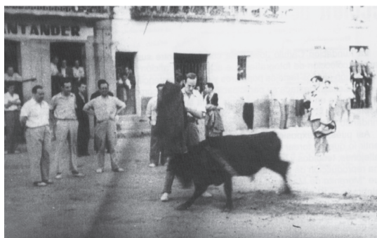
Fig. n.º 42.- Camilo José Cela pasa por alto a un toro en las fiestas populares de Cebreros (Ávila). Abella: Catálogo de la Exposición Cela y los toros , Madrid, Real Casa de Correos, 2014, pág. 46.

El Catálogo reproduce las 125 piezas que se exponen organizadas en distintos apartados: 1) La obra taurina de Camilo José Cela; 2) La Biblioteca Taurina del escritor; 3) La Hemeroteca, es decir, la serie de periódicos, revistas y recortes