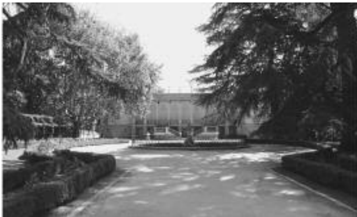
Fig. n.º 10.- Imagen del palacio en la actualidad / Julia Rivera.

Las talanqueras son de madera y no bordean la plaza en una circunferencia, sino que empiezan formando dos rectángulo-