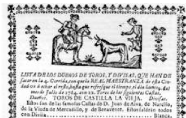
Fig. n.º 6.- Detalle de un cartel de un festejo taurino. Granada, 1764. Toros de la casta de Castilla la Vieja, de Benavente.

De cualquier forma, ¿cuándo adquirió antigüedad la torada de los condes de Benavente o la torada de los duques de