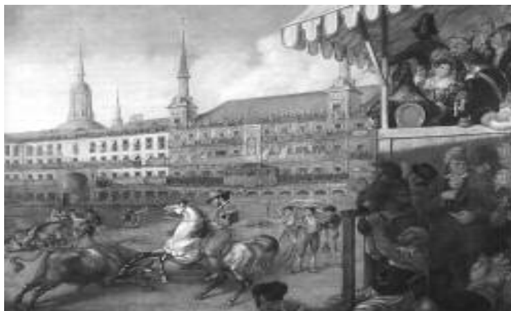
Fig. n.º 9.- Corrida de toros en la Plaza Mayor ; anónimo. En primer plano, a la derecha, se puede observar un balcón particular de madera y entoldado.