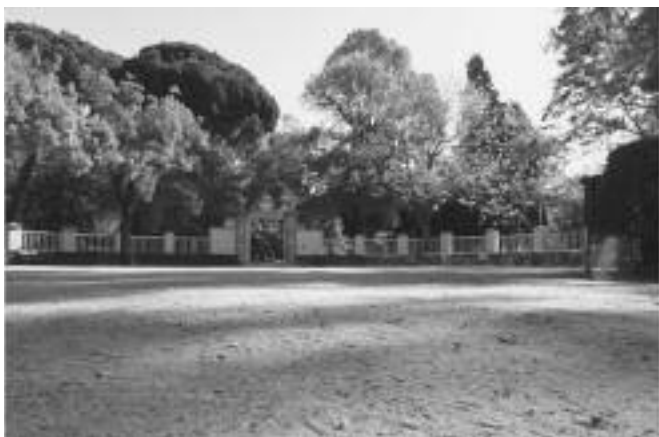
Fig. n.º 11.- El cuidado albero de la placita de toros de “El Capricho”, en La Alameda de Osuna / J.R.

Ejército del Centro con el general Miaja a la cabeza, la famosa Posición Jaca. Toda la finca se remueve y es acondicionada al uso militar: es arrasada. Se construye el famoso búnker –más bien, y quizá mejor denominado, el refugio– que recorre casi la mitad del subsuelo. El palacio aguanta en pie, y con suerte..., pues en 1936 un avión correo que acaba de despegar del aeropuerto de Barajas se incendia y cae en el jardín, en la zona de “El Laberinto”. No hubo víctimas.