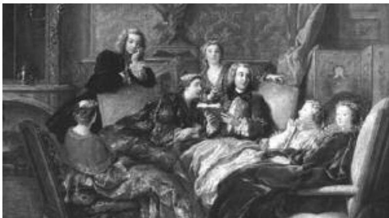
Fig. n.º 8.- Las salonnieres francesas reflejadas en Lectura de Molière , de Jean François de Troy. Colección Marqués de Cholmondeley.

Este dato que aporta quien posiblemente esté considerado como el mejor estudioso de los Osuna y “El Capricho”, el historiador Pedro José Navascués Palacio, lo dice todo: los novenos duques de Osuna forman inicialmente la biblioteca con 6.000 o 6.500 volúmenes, que la duquesa encarga al académico y enciclo-