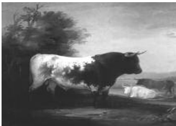
Fig. n.º 7.- Toros de Veragua , de José Elbo. Museo Real de la Academia de Bellas Artes San Fernando. Aparece representado el hierro de la ganadería de Fernando VII.

En 1844 falleció Pedro de Alcántara Téllez-Girón –no dejó descendencia– y el título de duque de Osuna pasó a su hermano