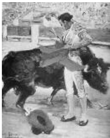
Fig. n.º 27.- Molinete de Domingo Ortega , Apud. Historia ilustrada de la Tauromaquia II , Colección Tauromaquia 17, Madrid, Espasa Calpe, láminas interiores.