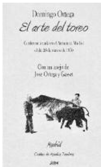
Fig. n.º 26.- Domingo Ortega. El arte del toreo , con un anejo de José Ortega y Gasset, Madrid, Centro de Asuntos Taurinos, Comunidad de Madrid, 2014.