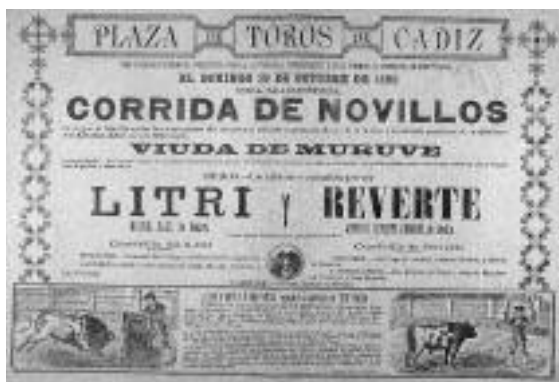
Fig. n.º 29.- Cartel de una corrida de novillos en Cádiz, 1890, donde se especifica que los novillos deben tener cuatro años cumplidos.

puesta es bien sencilla: lo que ocurre es que el torero ha estado dando pases, muchos pases, pero darlos, para Domingo Ortega, «no es lo mismo que torear». El insigne matador confiesa que un torero puede temer al toro, eso es humano, e incluso general, pero si ha sido capaz de instrumentarle unas decenas de pases, estéticamente, del gusto del público que lo ha jaleado, parece evidente que el lidiador no ha sido disminuido por el miedo, sino todo lo contrario, pero... si no lo ha reducido, si no ha sometido