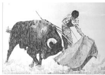
Fig. n.º 27.-

la Conductasa piriglutina , sintetizada y patentada por ellos. Para su campaña utilizaron una serie de plumillas (15x21,5 cms.) –tal vez realizadas sobre fotografías– también de buena calidad, aunque no tanta como que la de Antonio Casero, del dibujante madrileño Cándido Bernardo Masides, conocido como Bernardo Olabarria (1921-1994), sobre las suertes del toreo. (Fig. n.º 27).