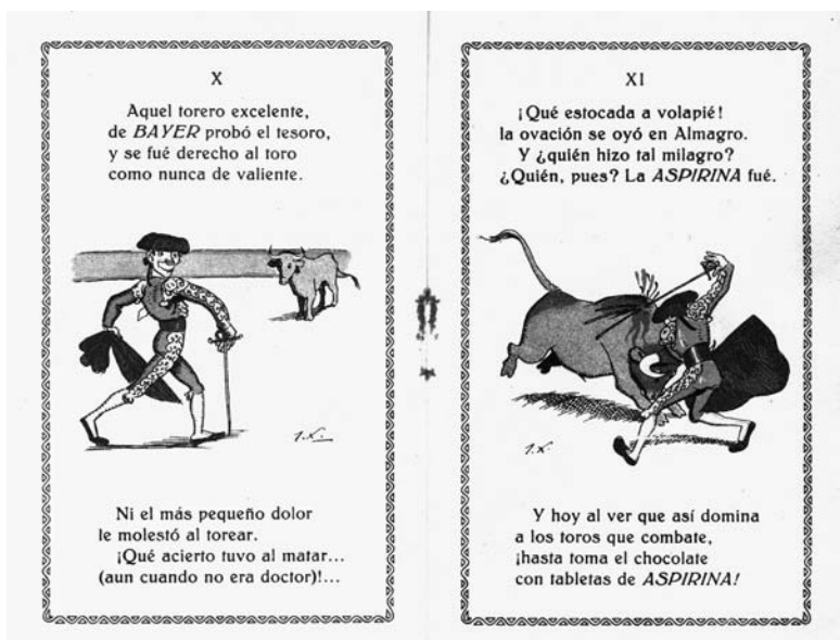
Fig. n.º 29.-