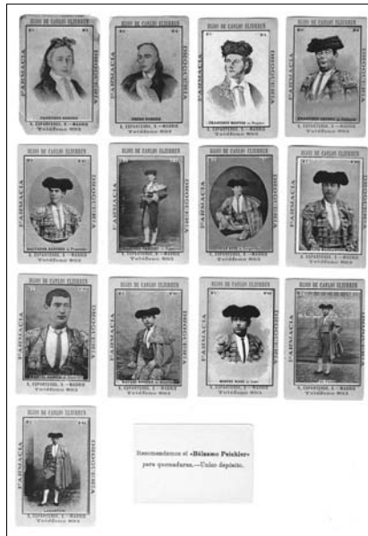
Fig. n.º 22.-

Si tenemos en cuenta estos datos, que la citada farmacia cambió de ubicación en 1898, desde la madrileña calle Imperial, nº 1 y 8, a la calle Esparteros nº 9, conservando el mismo número de teléfono (893), así como, los nombres de algunas figuras celebradas: Francisco Cúchares (1818-1868); Salvador Sánchez, Frascuelo (1842-1898); su hermano Francisco Sánchez, apodado de la misma manera (1843-1924); Manuel García, Espartero