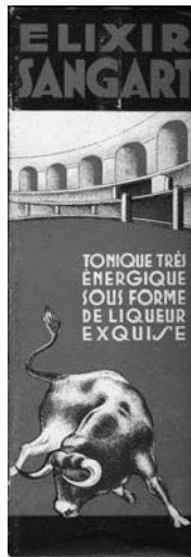
Fig. n.º 31.-