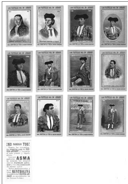
Fig. n.º 23.-

Miguel Báez, Litrí (1869-1932, entre otros muchos, no cabe duda de que el anuncio fue impreso a finales del siglo XIX o principios del XXI, lo cual, unido al interés de la serie para los amantes de la tauromaquia, hizo que nos costara un auténtico potosí. Lo adquirimos, hace muchos años, pensando que sería algo excepcional en nuestra colección de propaganda farmacéutica: nos equivocamos en la previsión.