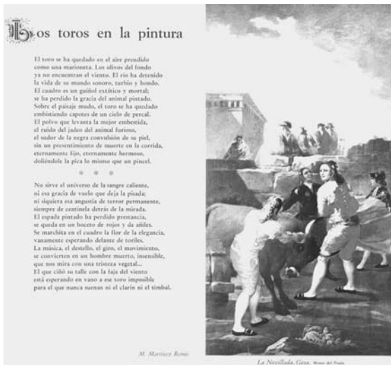
Fig. n.º 28.-

El Vigoron fue un remedio de principios del siglo, reflejado en la web del Museo del Objeto de México. Prometía proporcionar «magnetismo, puesto que será la causa de su vitalidad, colmando de salud y vigor a todos los tejidos del cuerpo por medio de su acción vivificante sobre la sangre ». Sus promotores enviaban unas tarjetas postales (8,5x13,5) sobre la ovación y la oreja , de mala calidad.