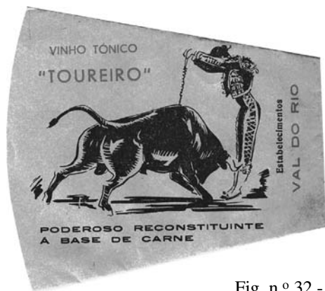
Fig. n.º 32.-

También los portugueses, pese a su lidia sin muerte, publicitaron el Vinho tónico Toureiro , un poderoso reconstituyente a base de carne, mediante un banderillero. (Fig. n.º 32). Todo lo cual indica que la publicidad farmacéutica se valió extensamente de la fiesta de los toros, cuando era más popular, para cumplir con su finalidad de llegar a la mayor cantidad posible de personas, como cualquier otro objeto de consumo.