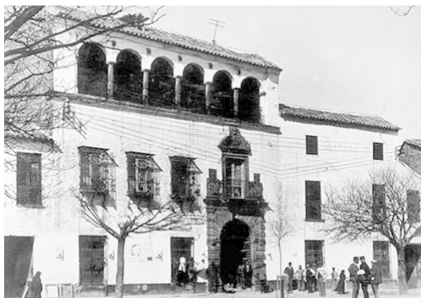
Fig. n.º 4.- Palacio del Marqués del Puente de la Virgen, (Pérez Serrano) de finales del siglo XVI y comienzos del XVII (1616 según Palomino). Estaba situado enfrente de la parroquia de San Miguel, en la plaza del Mercado. Su galería alta servía de mirador para contemplar los festejos taurinos que se celebraban en dicha plaza. Fue derribado en 1918.