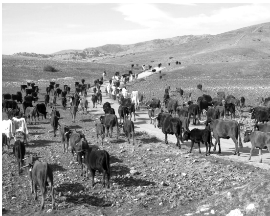
Fig. n.º 5.- Trashumancia de toros hacia Sierra Morena.

Hay que considerar que el aspecto más destacado de su actividad taurina es la exportación de sus reses bravas que tradicionalmente han abastecido las plazas de toros y los festejos populares de toda España. Aunque, como hemos dicho la tradición de festejos taurinos es antigua, la capacidad de criar toros de las ganaderías provinciales es mayor lo que generó un excedente que