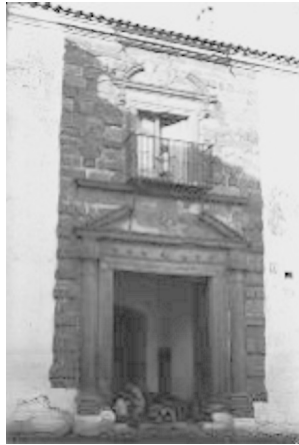
Fig. n.º 1- Casa palacio de los marqueses de La Merced, fue levantada por Pedro Estanilao de Quero y Valenzuela, segundo marqués de la Merced, hoy desaparecida. Tenía un magnífico archivo referente a Andújar en la primera mitad del siglo XVIII. Este desapareció durante la guerra civil. La casa también se demolió en los años 1950 aproximadamente.

También durante el siglo XX se ha ido produciendo un destacado incremento en la cría de toros de lidia en la provincia. Así, según Barga Bensusán (1998), en la segunda mitad del siglo XIX sólo se presentaron en Madrid dos ganaderías de lidia jiennenses 10 , mientras que entre 1900 y 1961 se presentaron 22 ganaderías.