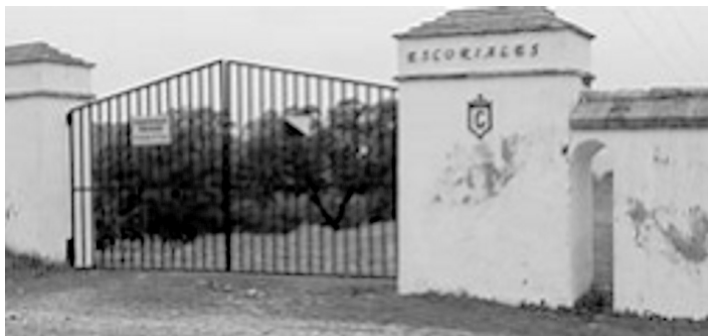
Fig. n.º 2.- Finca “Los Escoriales” entre Andújar y Villanueva de la Reina, donde pastan los toros de la ganadería de Germán Gervás, próxima está “La Medianería” de Herederos de Flores Albarrán, ambas de procedencia Santa Coloma.