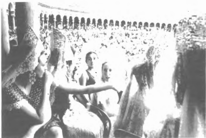
Fig. n.º 35.— Jóvenes con mantillas en el palco de la Real Maestranza de Caballería de Sevilla.

Cuando la edad de oro del toreo se simboliza en la época de José y Juan, el cinematógrafo, descendiente directo de la fotofija, era aún mudo, adelantándose en el tiempo a Bergamín, en aquello de la música callada del toreo, para quién el cante es Rafael de Paula y el canto es Curro Romero.