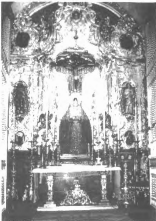
Fig. n.º 43.— Estado actual de la capilla donde se aprecia, en el suelo, la lápida (Apud.: Álvarez Velázquez, 1995: 195).

consigue tan brevemente predisponer al público en su favor, que es cuestión de que el toro y él se encuentren en un punto dado. Su exagerado valor, del cual se complace en hacer alarde, derrochándolo verdaderamente, le conquista desde luego, las simpatías del espectador; sus cambios capote al brazo, su frescura y atrevimiento en los trances difíciles, sus pares de banderillas, quebrando tan en corto que parece que no tiene salida sin enganche o revolcón y hasta el modo de entrar a herir son causa de que arrebate hasta el frenesí a los concurrentes, que en aquel momento no pueden pararse a discernir, por la sugestión que en ellos ejerce el poder de la valentía, si el Arte o la Providencia han ayudado a salvar el peligro» (pág. 60).