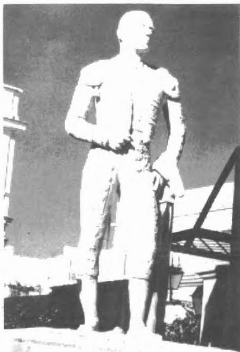
Fig. n.º 44.— Monumento erigido a Reverte en su pueblo natal frente al Ayuntamiento y su casa familiar (Apud.: Álvarez Velázquez, 1995: 201).

El valor, la inventiva, la generosidad, la simpatía de Reverte empujaron a que poetas, artistas, músicos, novelistas, rapsodas y tonadilleros se entregaran, con sus creaciones,