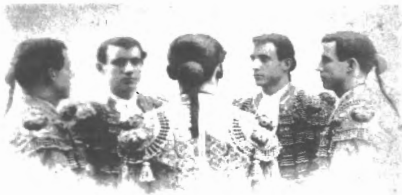
Fig. n.º 40.— Retrato de Reverte . La coleta vista desde varios ángulos (Apud.: Álvarez Velázquez, 1995: 117).

Pronto hará un siglo que Antonio Reverte, el torero de las coplas, de los cantares y de los amores, descansa en la cripta de la capilla de la Vera-Cruz de Alcalá del Río. Reverte fue una estrella fulgurante que cruzó, vertiginosa, la gloria taurina pero ¡ay! lució apenas dos lustros. Una gran figura del