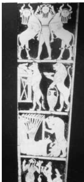
Fig. n.º 2.- Caja musical de un arpa. 3000 - 2340 a. de C. Ur (Mesopotamia). Museo de Filadelfia.