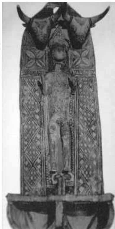
Fig. n.º 4.— Portalámparas. S. IX a. de C. Chipre. Col. Hadjiprodomou (Famagusta).

Mitra 8 indoario. Cuenta la leyenda que de su muerte fecunda brotaron todas y cada una de las especies vivientes.