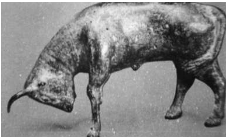
Fig. n.º 3.— Torito de bronce. Período romano. Anatolia. Museo de Ankara.

ceremonial. Los contraluces de la tarde dificultan, a veces, vislumbrar la silueta de ambos. Sus figuras se entrelazan y engarzan, emulando, como antaño, la mítica e inefable imagen del hombre-toro, símbolo de elevación de lo terrestre a lo divino, transformado después por la mitología egea en Minotauro guardián de una sabiduría superior, accesible sólo a aquellos que, como el heroico Teseo 4 , logran vencerle.