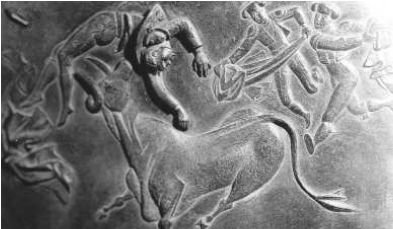
Fig. n.º 29.— Ferrant.: Diestro volteado , bronce 32 x 50 cms., bronce. Madrid, Col. M. Barberá (Apud. Casado, 1997: 78).

De 1937 a 1947 no hay en España visiones totales del mundo: sólo las visiones-fragmentos que ha dejado una guerra llevada adelante por dos visiones totalizadoras. Y el héroe popular que encarnaron los toreros antiguos y Joselito o el