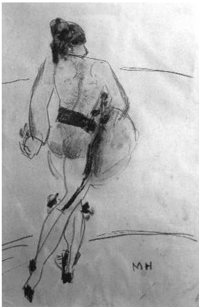
Fig. n.º 30.– Vázquez Díaz: Ignacio Sánchez Mejías , carbón sobre papel, 38 x 36 cms., Madrid, Col. particular (Apud. Casado, 1997: 107).