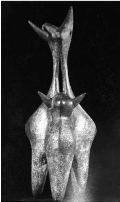
Fig. n.º 31.— Sánchez, Alberto: Toro ibérico , bronce, 65 x 26 x 12. Madrid, Col. part. (Apud. Casado, 1997: 99).

ño formato, Benjamín Palencia o Pepe Caballero. Eran aires inconexos, balbuceantes (o quizá miedosos), rechazando el hieratismo y asentados sobre todo en el sentimiento. Porque