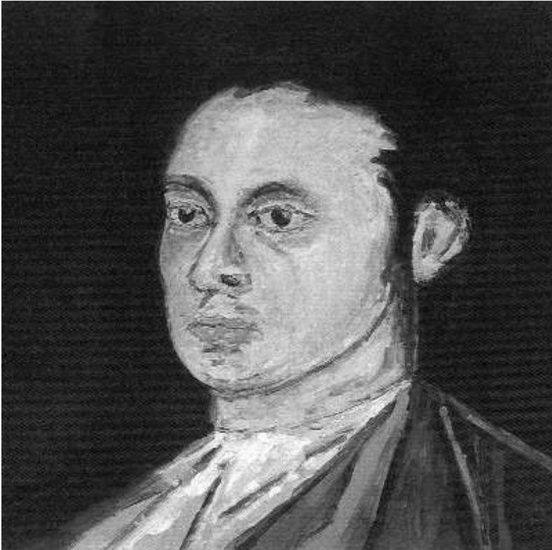
Fig. n.º 56.– Un aficionado : Goya, 1994, óleo/tabla, 100 x 100 cm.