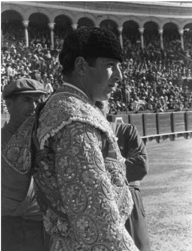
Fig. n.º 9.- Retrato de Antonio Ordóñez , 1961.