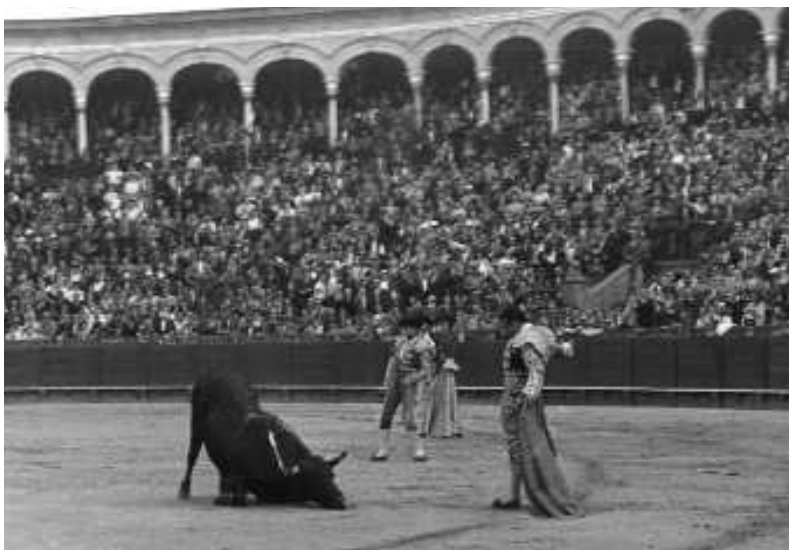
Fig. n.º 18.— Toro derrotado ante Antonio Ordóñez, 1960 (Foto de Cubiles, apud Hemeroteca Municipal de Sevilla: por cortesía del Área de Cultura del Ayuntamiento de Sevilla y las Fundaciones El Monte —Huelva y Sevilla— y Cruz Campo ).

Ordóñez intentó sujetarlo. Lo consiguió en el centro de la plaza, con cuatro lances formidables. En el quite brilló de nuevo el arte del torero de Ronda. El toro se arrancaba bien al caballo, recargando. Brindó Antonio Ordóñez la faena a don Antonio García-Carranza. Los primeros pases, doblando con suavidad, fueron de una calidad extraordinaria. Brotaron las primeras exclamaciones admirativas del público. Después ligó una