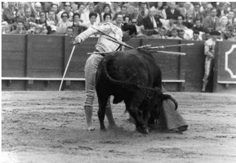
Fig. n.º 14.— Pase de pecho de Antonio Ordóñez, 1967 (Foto de Gelán, apud Hemeroteca Municipal de Sevilla: por cortesía del Área de Cultura del Ayuntamiento de Sevilla, Fundación El Monte —Huelva y Sevilla—, Real Maestranza de Caballería de Sevilla y Fundación Sevillana de Electricidad).

»En la historia de la plaza de la Maestranza hay varias faenas que ocupan lugares preeminentes. La del Gallo en el toro de la Guerrero; la de Gaona con el de Santa Coloma; la de Belmonte el día de la alternativa del Niño de la Palma , por citar solamente las de la época anterior a nuestra guerra. Entre las de la época moderna tiene que quedar grabada la de Antonio Ordóñez en el día de la alternativa de Chicuelo , salvando, como es natural, la diferencia de enemigo en aquellas que citamos y ésta de ahora.