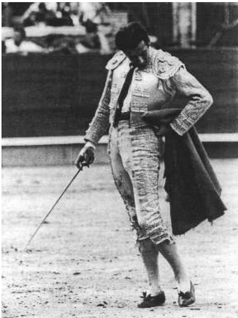
Fig. n.º 15.— Un gesto incopiable... (Foto de Arjona, apud Abad Ojuel, A.: Estirpe y tauromaquia de Antonio Ordóñez , Madrid, Espasa-Calpe, 1988, pág. 193).