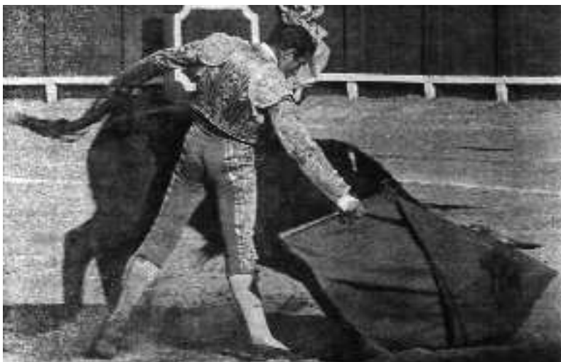
Figs. n.º 11 y n.º 12.— Pases con la mano derecha de Antonio Ordóñez (Apud Corrochano, G.: Tauromaquia. Obra Completa. I , Madrid, Espasa-Calpe, 1989, pág. 390).