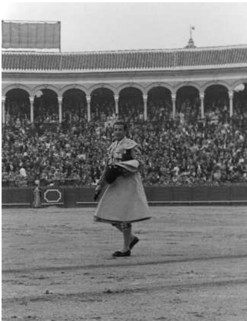
Fig. n.º 20.- Cubiles: Triunfo de Antonio Ordóñez , 1960.