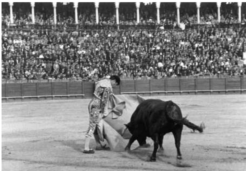
Fig. n.º 10.– Pase de verónica de Antonio Ordóñez, 1960.

»Se cuela bastante el tercero en su embestida. Su pelea con los caballos es de bravo, pero en cuanto a toreo con el capote no vemos nada. Luque Gago coloca un gran par de banderillas, Manolo Vázquez empieza superiormente su faena de muleta. En cuatro pases por bajo dobla al