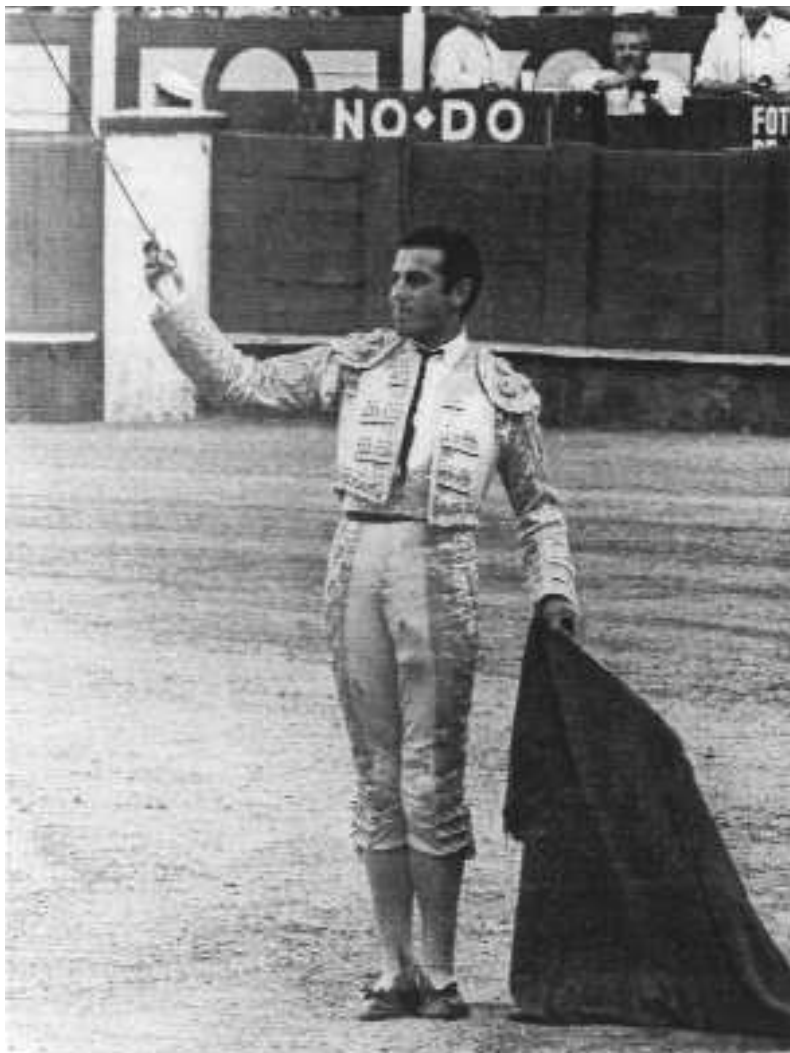
Fig. n.º 19.- Tras la ovación (Foto de Arjona, apud Abad Ojuel, A.: Estirpe... , op. cit. , pág. 348).