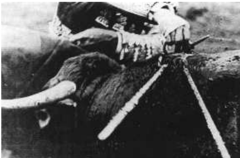
Fig. n.º 17.— La estocada en detalle... (Foto de Montes, apud Abad Ojuel, A.: Estirpe... , op. cit. , pág. 192).

carnes, fue muy suave y claro. Ordóñez, tras recogerlo con mucho arte, rodilla en tierra, lo tomó en cuatro lances maravillosos de cámara lenta, que levantaron una tempestad de aplausos. Cada lance un olé, cada verónica una ovación. Pero las gentes se quedaron con la miel en los labios, porque el toro, flojo de patas, comenzó a caerse. Se malhumoró el público, porque barruntó que se frustraba la faena. Efectivamente, se había acabado el toro. Trató entonces Ordóñez de aprovechar al máximo lo