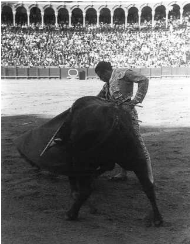
Fig. n.º 13.– «Derechazo» de Antonio Ordóñez, 1961 (Foto de Gelán, apud Hemeroteca Municipal de Sevilla: por cortesía del Área de Cultura del Ayuntamiento de Sevilla, Fundación El Monte –Huelva y Sevilla–, Real Maestranza de Caballería de Sevilla y Fundación Sevillana de Electricidad).